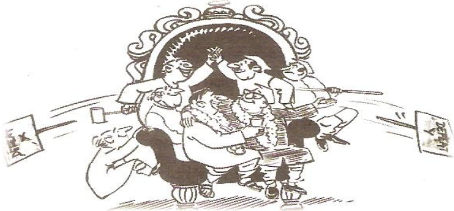
ಶತ್ರುಗಳು ಚರಕಾಲ ಬಾಳಲಿ

ನಾವು ಏಕೆ ಈ ಮಾದರಿಯನ್ನು ಆರಿಸಿಕೊಂಡೆವು. ಇದಕ್ಕೆ ಇದ್ದ ಕಾರಣವೆಂದರೆ ನಮಗೆ ಬ್ರಿಟನ್ನಿನ ವಿಧಾನದಲ್ಲಿದ್ದ ಗೌರವ ಮತ್ತು ಅದನ್ನು ಬಳಸಿಕೊಳ್ಳುವುದರಲ್ಲಿ ನಮಗಿದ್ದ ಸೌಲಭ್ಯ. ನ್ಯಾಯಶಾಸ್ತ್ರ ಪಾರಂಗತರಾಗಿದ್ದ ಶ್ರೀ ಎಂ.ಸಿ ಚಾಗ್ಲಾ ಅವರ ಮಾತುಗಳಲ್ಲಿ ಹೇಳುವುದಾದರೆ ಬ್ರಿಟಿಷ್ ಮಾದರಿಯ ಪಾರ್ಲಿಮೆಂಟರಿ ಪ್ರಜಾಪ್ರಭುತ್ವದ ಕಡೆ ನಾವು ಒಲವು ತೋರಿಸಿದ್ದಕ್ಕೆ ಕಾರಣಗಳಲ್ಲಿ ಮುಖ್ಯವಾದವು 1. ಸ್ವಾತಂತ್ರ್ಯಕ್ಕೆ ಮುಂಚೆ ನಾವು ಕೇಂದ್ರದಲ್ಲಿ ಮತ್ತು ರಾಜ್ಯಗಳಲ್ಲಿ ನಮ್ಮ ಶಾಸನ ಸಭೆಗಳನ್ನು ಸ್ವಲ್ಪ ಹೆಚ್ಚು ಕಡಿಮೆ ಬ್ರಿಟನ್ನಿನ ಮಾದರಿಯಲ್ಲೇ ನಡೆಸುತ್ತಿದ್ದೆವು. ಆದರಿಂದ ನಮಗೆ ಆ ವಿಧಾನದ ಅಭ್ಯಾಸಗಳು, ಸಂಪ್ರದಾಯಗಳು, ರೀತಿ ನೀತಿಗಳು ಕರಗತವಾಗಿದ್ದವು ಮತ್ತು 2. ರಾಷ್ಟ್ರದ ಅತ್ಯುನ್ನತ ಸ್ಥಾನದಲ್ಲಿ, ಆಡಳಿತದ ಮುಖ್ಯಸ್ಥರಾಗಿ ರಾಷ್ಟ್ರಪತಿ ಇದ್ದರೆ, ನಮಗೆ ನಮ್ಮನ್ನು ಹಿಂದೆ ಆಳಿದ ರಾಜರು, ಚಕ್ರವರ್ತಿಗಳು ನೆನಪಿಗೆ ಬರುತ್ತಿದ್ದರು.